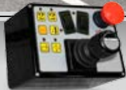
Proportional Steuerung XTC