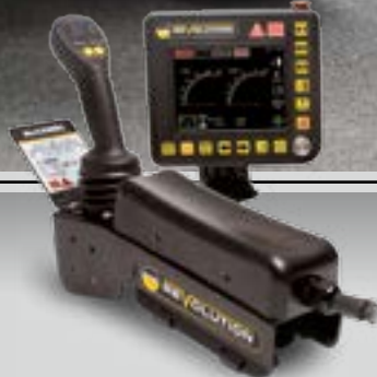
Revolution Proportional Steuerung