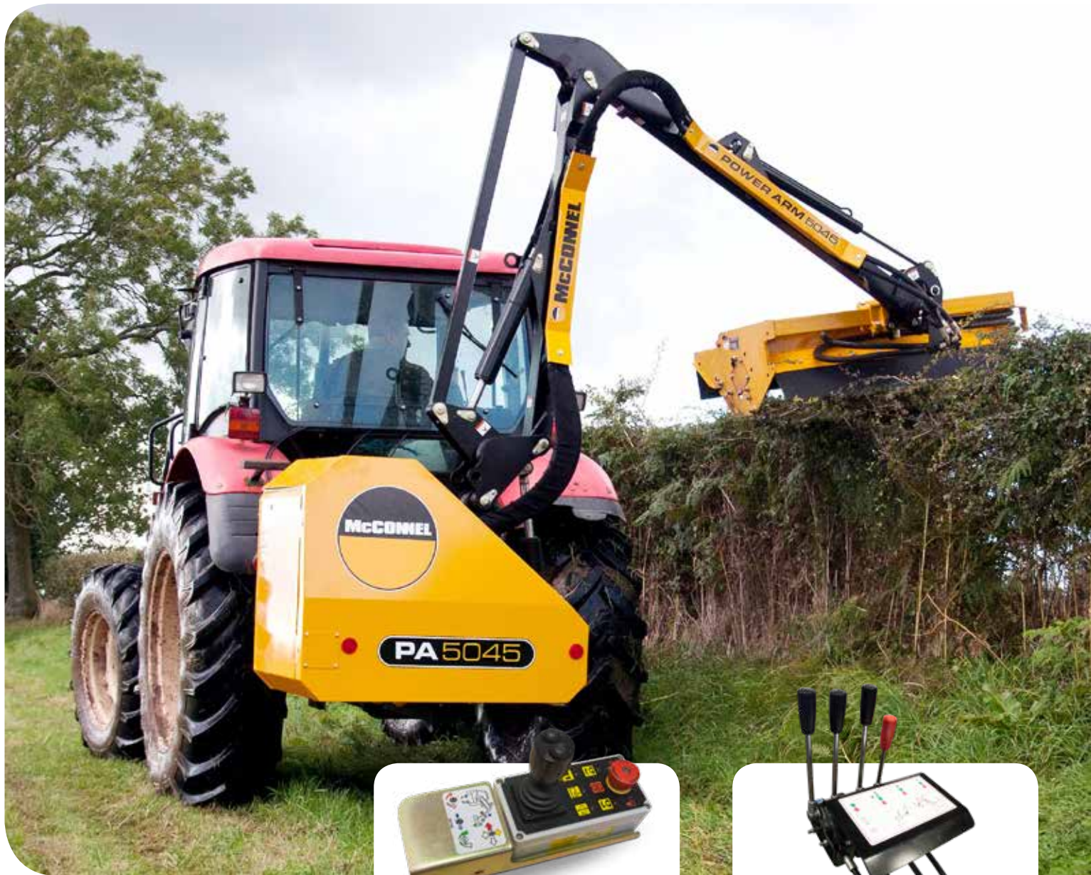
Steuerung mini-XTC, Elektro-Proportional (Option)